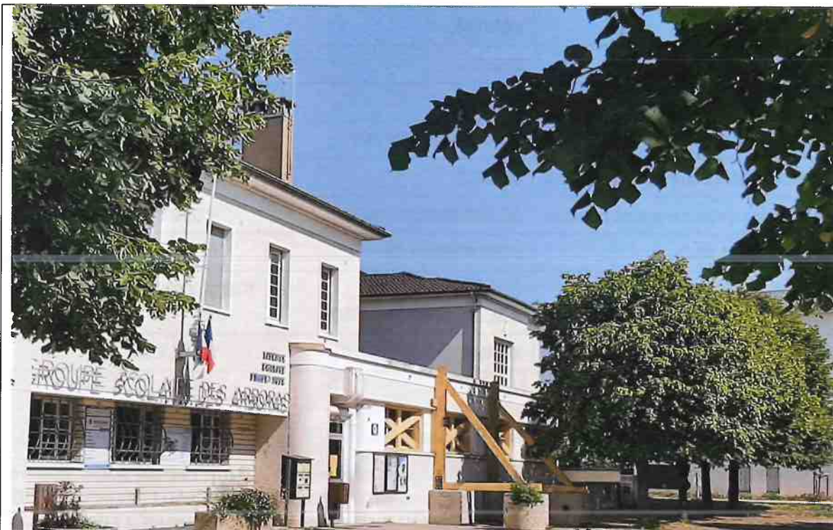
Etalement de la façade avant démolition du bâtiment.

A l'été 2022, l'ancien pôle Enfance et l'ancien restaurant scolaire ont été aménagés en classes provisoires pour accueillir une partie des élèves et l'équipe éducative pendant toute la durée des travaux.