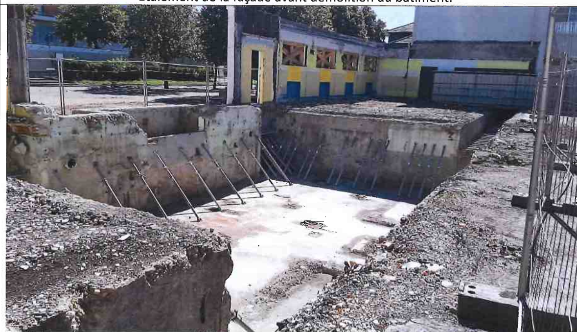
A l'issue de la démolition du corps central, seuls les murs du rez-de-chaussée des anciens préaux côté parvis ont été conservés.