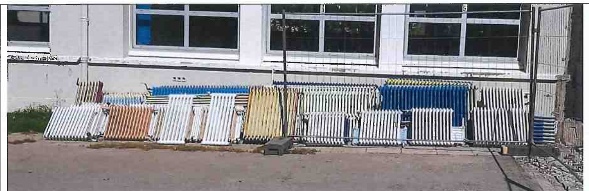
Les anciens radiateurs en fonte ont été déposés et seront récupérés par l'entreprise Frédéric Matt pour réemploi après un déplombage complet.